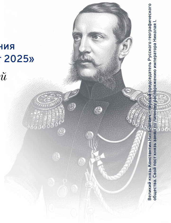
Великий князь Константин Николаевич – первый председатель Русского географического общества. Свой пост князь занял по личному распоряжению императора Николая I.